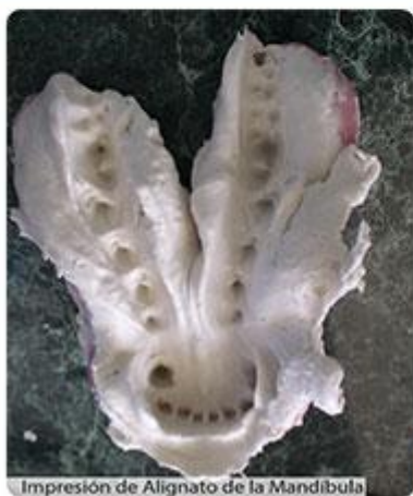
Impresión de Alignato de la Mandíbula

Taller 2: Férulas Interdentarias Indirectas