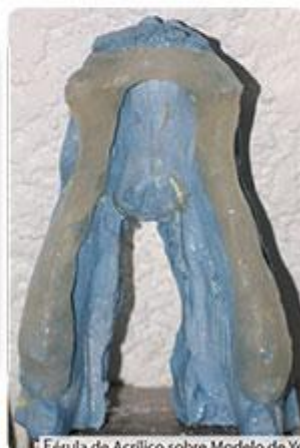
Férula de Acrílico sobre Modelo de Yeso