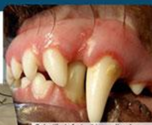
Colmillo Inferior Lingualizado