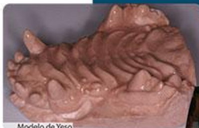
Modelo de Yeso