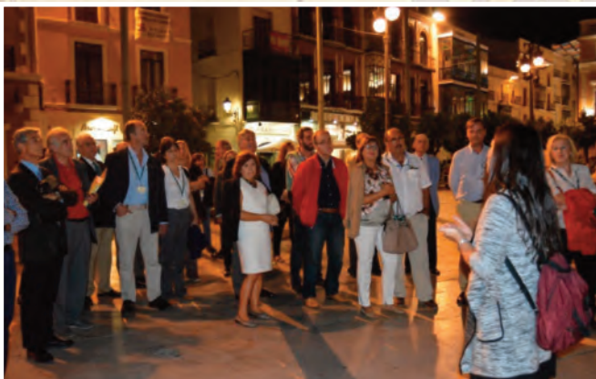
Recorrido por casco histórico de Badajoz

Los congresistas y acompañantes pudimos disfrutar de una visita guiada por el casco histórico de Badajoz, y de un espectáculo de luz y sonido en la Plaza Alta, seguido de una recepción en la antigua Casa Consistorial por parte del Ilmo. Sr. Alcalde de Badajoz.