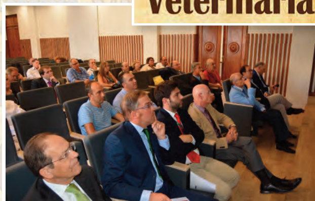
Salón durante la conferencia inaugural