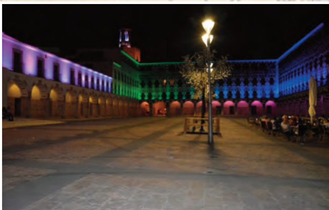
Espectáculo de música e iluminación