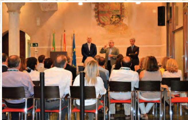
Recepción en las Casas Consistoriales.