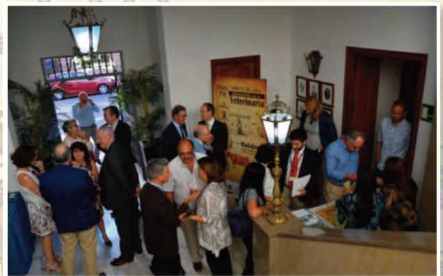
Recepción de congresistas