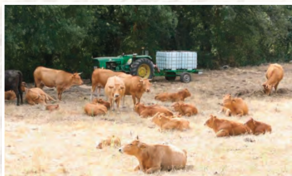
Ejemplares de raza rubia gallega.

Además de su labor agraria, se le atribuye el mérito de evitar el derribo de la muralla de Lugo. En los años 20, se barajó esa posibilidad para favorecer el crecimiento de la ciudad y emplear la piedra de la muralla en otros lugares, como los puertos de A Coruña y Ferrol. Rof Codina no estaba de acuerdo y, para disuadir a los promotores de esa idea, hizo un cálculo de los carros que serían necesarios para realizar la operación y el espacio preciso, por lo que la idea se descartó.