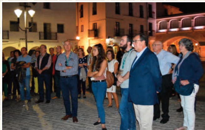
Recorrido por casco histórico de Badajoz